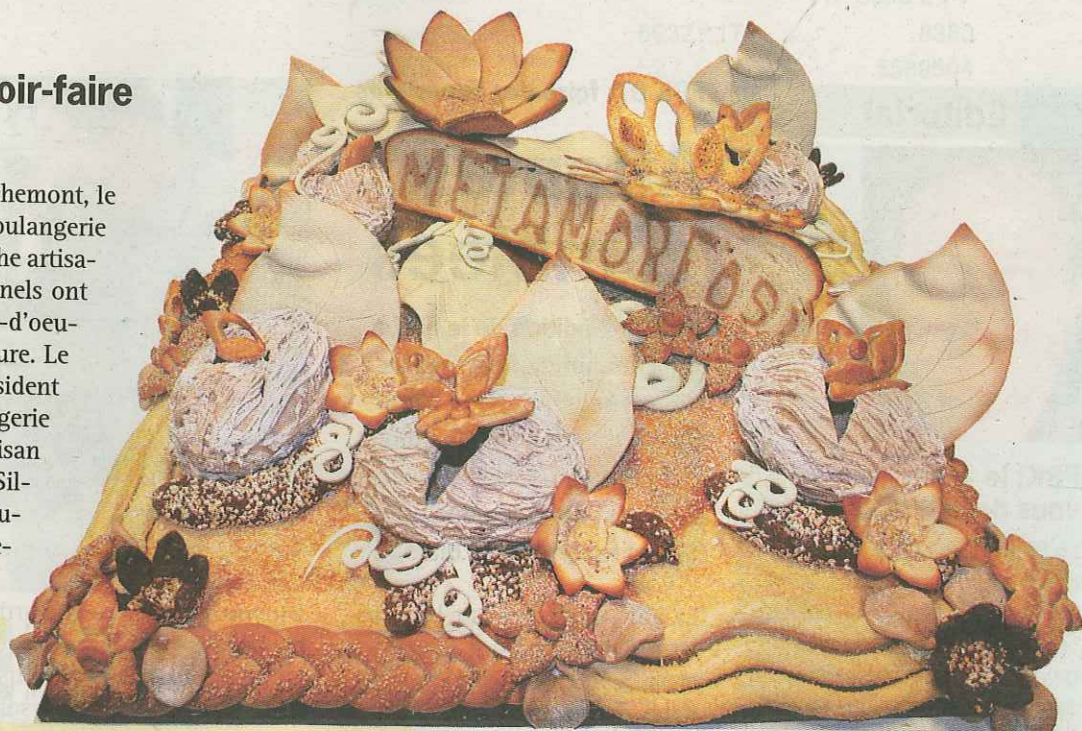
1. Ferruccio Masoni, Silvaplana