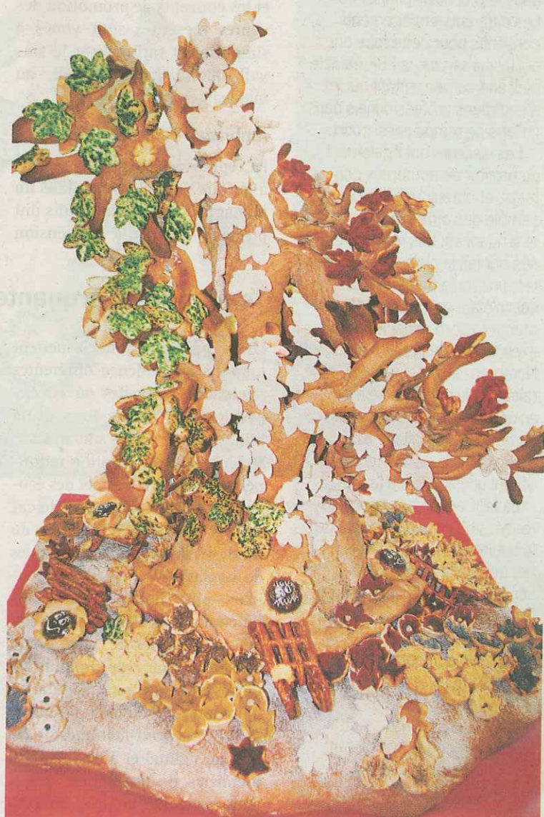
2. Arlette Picard, Reconvilier